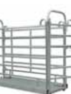
Váha na zvířata M