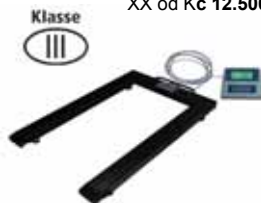
XX od Kč 12.500,- KPZ 1 M Ex Paletová váha