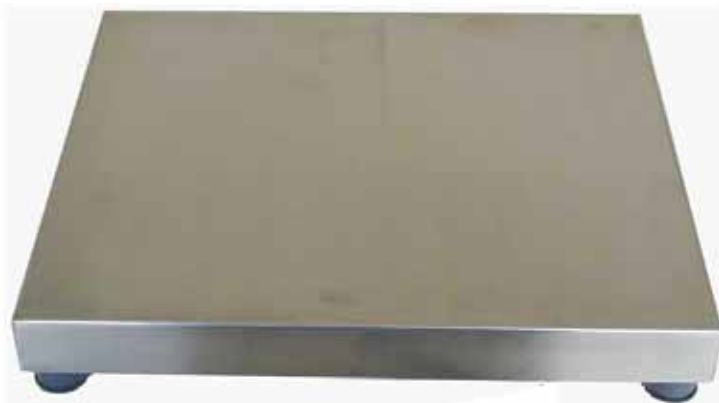
Příslušenství za příplatek: nerezová plošina