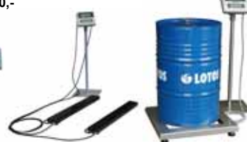
KPZ 1 B