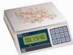
KPZ 2-03 M Přesná váha