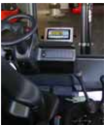
KPZ 39 Váha pro hydraulické vysokozdvíhací zařízení