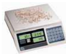
KPZ 2-04 M Počítací váha