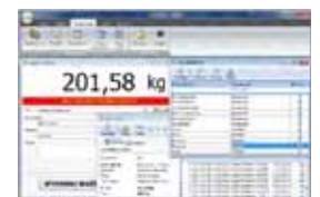
KPZ PC Software

XX = KPZ váhy slevy do vyprodání zásob !