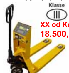
XX od Kč 18.500,- KPZ 71-* M Ex Paletový vozík s váhou