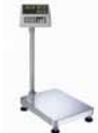
KPZ 2E-06S M Ex KPZ 2E06N IP 69K