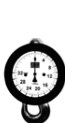
Jeřábové váhy M