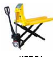
KPZ 74 Paletový vozík s váhou