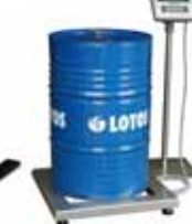
KPZ 2B M