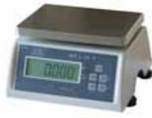
KPZ 2-03-10 IP 65 Vodotěsná váha