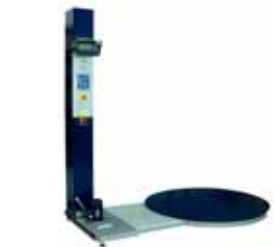
Vážicí systém pro stroje na balení palet