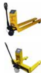
Příslušenství KPZ 71-7