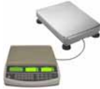
KPZ 2082 Systém počítačích vah