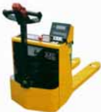
KPZ 72 M Ex Vážicí sada