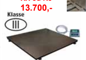
KPZ 2 M Ex Plošinová váha