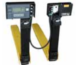
KPZ 76 Váha na vysokozdvíhací vozíky